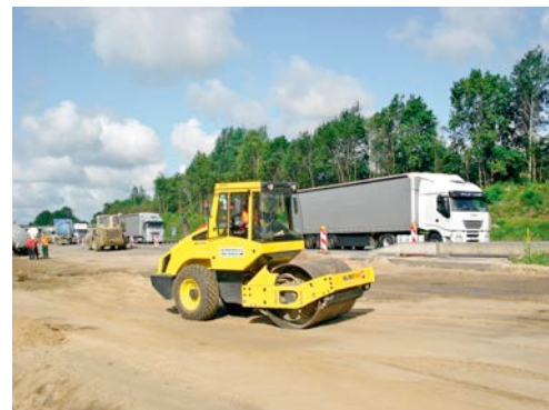
Walzen aus dem HKL MIETPARK sind beim Ausbau der A 1 zwischen Hamburg und Bremen im Einsatz..