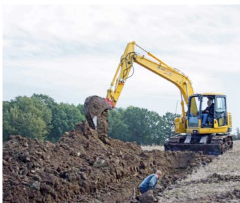
Mit Drainagelöffel arbeitet sich der stabile Komatsu PC 138-US-8 aus dem HKL MIETPARK durch den nassen Feldboden. Dank seines günstigen Gewichtes und der Spezialketten steht er auch auf schwammigen Boden sicher.