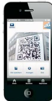
Mit dem integrierten QR-Reader der HKL App werden alle Produktinfos direkt online angezeigt.