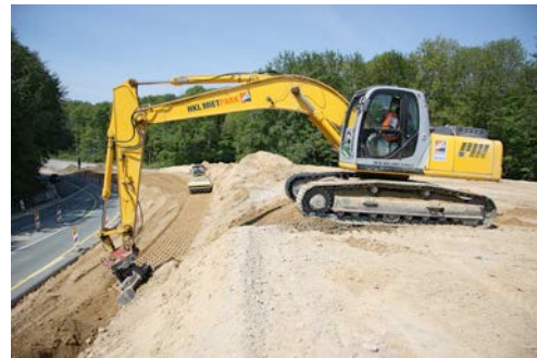
Bagger und Walzenzüge aus dem HKL MIETPARK unterstützen die Arbeiten an der A 39 / A 391.