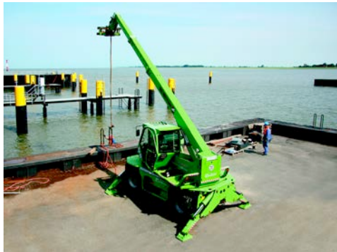
Merlo Roto Teleskopmaschine 38.16 aus dem HKL MIETPARK übernimmt Verladearbeiten beim Bau des neuen Schlepperhafens in Bremerhaven.