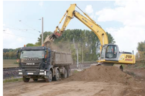
26 Tonnen-Raupenbagger aus dem HKL MIETPARK beim Befüllen eines Kippers auf der Gleisbaustelle der DB Netz AG in Niedersachsen.