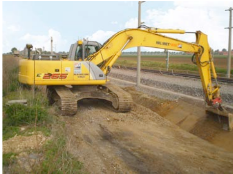
26 Tonnen-Raupenbagger aus dem HKL MIETPARK sind auf der Gleisbaustelle der DB Netz AG in Niedersachsen im Einsatz.