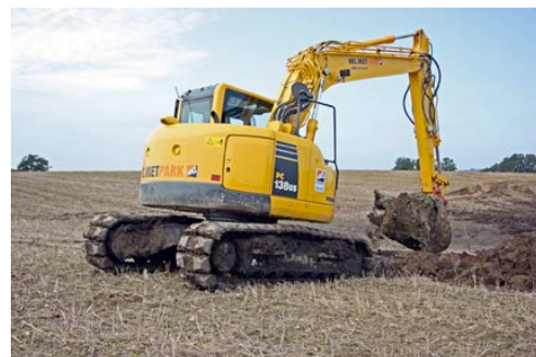
Ursprünglich als Stadtbagger konzipiert, bewährt sich der Komatsu PC 138-US-8 aus dem HKL MIETPARK auch bei Drainagearbeiten auf dem Feld.