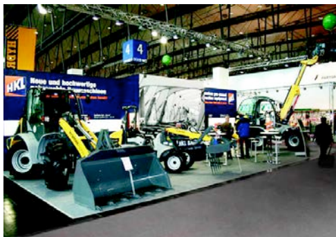
HKL präsentiert auf der Agritechnica 2011 neue und gebrauchte Baumaschinen, darunter Radlader und Teleskoplader von Kramer..