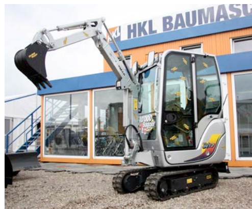
Mit der Übergabe des 10.000sten Baggers in speziellem Design an HKL würdigt Yanmar 25 Jahre erfolgreiche Partnerschaft.