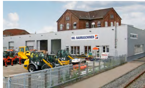
Das modern gestaltete Center in Heilbronn bietet das gesamte Sortiment des HKL MIETPARKs an.