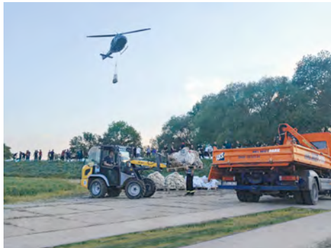
LKW-Kipper und Radlader aus dem HKL MIETPARK waren unermüdlich an den Deichanlagen im Einsatz.