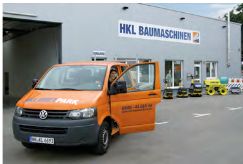
Das moderne neue HKL Center Heilbronn startete am 1. Juli seinen Betrieb.