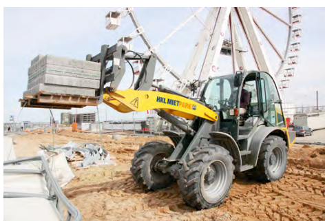
Wendige Radlader aus dem HKL MIETPARK transportieren Erdaushub und Materialien an jeden Winkel des Parks.