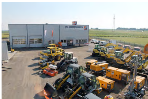
Der HKL BAUSHOP bietet eine große Auswahl an Baugeräten zum Kauf.