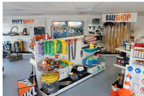
Im HKL Center Wolkersdorf finden Kunden Qualitätsprodukte führender Baumaschinen-Hersteller samt Zubehör.