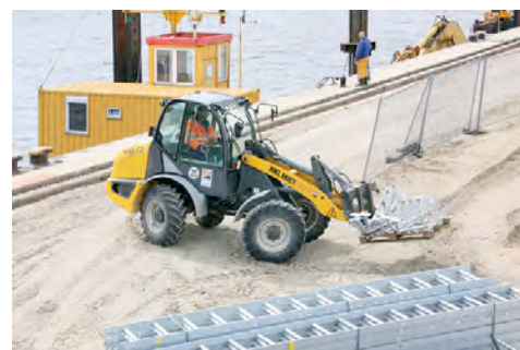
Radlader von HKL als Materialbeförderer – hier beim Transport von Geländer-Bügeln.