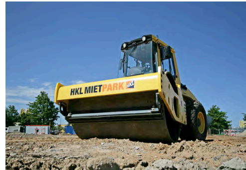
Walze aus dem HKL MIETPARK bei Verdichtungsarbeiten.