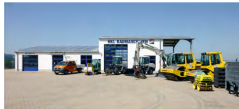
Neues HKL Center in Bayreuth eröffnet