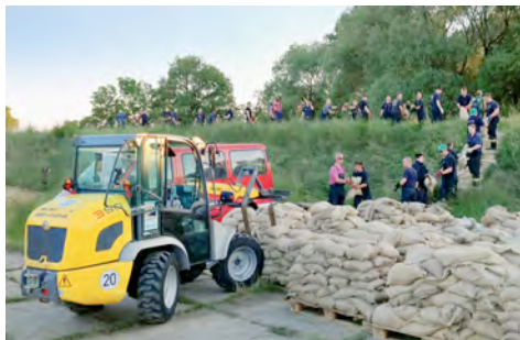
Radlader aus dem HKL MIETPARK stapelten Paletten mit Sandsäcken im Bereitstellungsraum für die Personenketten.