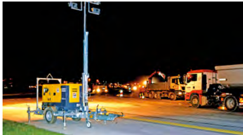
Leistungsstarke Lichtgiraffen aus dem HKL MIETPARK waren unermüdlich im Einsatz.