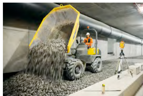
Ein Dumper von HKL transportiert den für die Gleisanlage benötigten Schotter und kippt ihn auf den jeweiligen Abschnitten ab