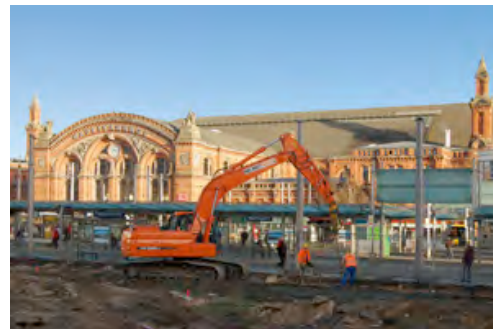
Ein 24-Tonnen-Raupenbagger von HKL bei der Tiefensondierung auf dem Bremer Bahnhofsvorplatz.