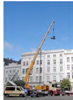
Spektakuläre Anlieferung: Für Arbeiten im Innenhof der Lübecker Altstadt Häuser werden Maschinen von HKL per Kran an ihren Einsatzort transportiert.