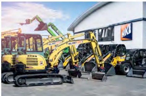
In den gut ausgestatteten HKL Centern finden Baufirmen zuverlässige Baumaschinen in beliebiger Stückzahl.