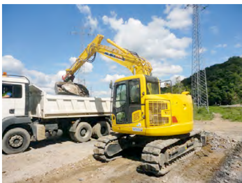
Raupenbagger aus dem HKL MIETPARK erledigen effizient den Erdhaushub für den Pfeilereinbau westlich der Lennetalbrücke.