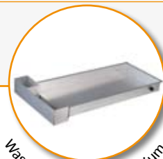
Wasserwanne aus Aluminium.