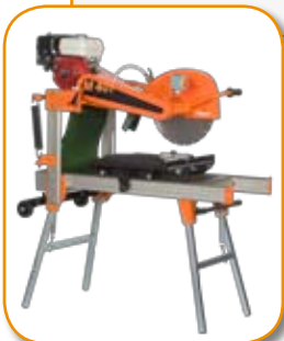
CM401 - Benzin