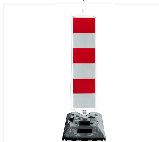
Leitbake waagrecht schraffiert