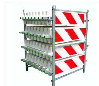
Transport- und Lagergestell