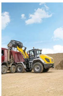
Der Kramer Radlader 8155 eröffnet eine neue Größenklasse.