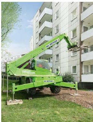
Der Merlo Roto 45.21 Teleskopstapler aus dem HKL MIETPARK stützte die Bodenplatten der Balkone und transportierte sie direkt am Haus entlang ab.