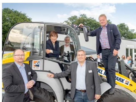
HKL präsentiert auf Berliner-Branchentreff den vollelektrisch betriebenen Radlader Kramer 5055e.