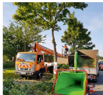
Das Ausstellungs-Highlight auf der GaLaBau 2018: verschiedene Arbeitsbühnen aus dem HKL MIETPARK.