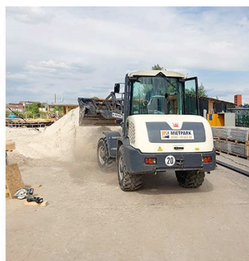
Ein Radlader aus dem HKL MIETPARK übernahm das Verteilen von 400 Tonnen Sand für den Party-Strand, der bis zu 2.000 Leute fasst.