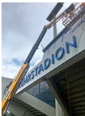
Bei der Stadionsanierung in Bochum überzeugte die Teleskopbühne aus dem HKL MIETPARK mit hoher Reichweite und festem Stand.