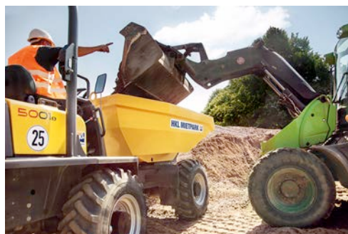
Helfer beim Sportstättenbau in Lübeck: Ein Dumper von HKL unterstützt Entwässerungsarbeiten auf dem Kunstrasenspielfeld.