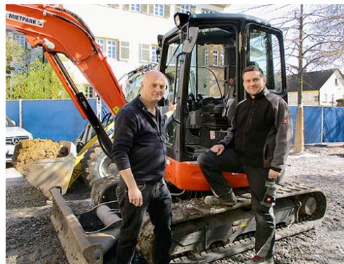
HKL Maschinen sind bei Sanierungsarbeiten am historischen Gärtnerhaus in Gemmingen im Einsatz.