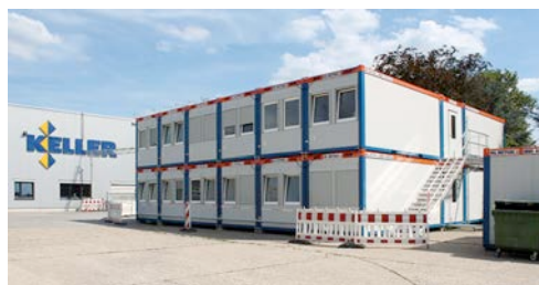
Die 435 Quadratmeter große Containeranlage mit 30 Einheiten aus dem HKL Kompetenzzentrum Raumsysteme besteht zum Großteil aus Einzelbüros.