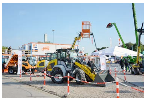
HKL auf der NordBau 2017: Im eigenen Messecontainer und auf dem angrenzenden Außengelände präsentiert der Branchenführer aktuelle Maschinen- und Gerätetrends.