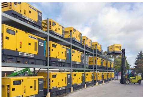
Im HKL Stromcenter NRW in Dortmund finden Kunden alles rund um die Themen Strom und Lichtenergie.