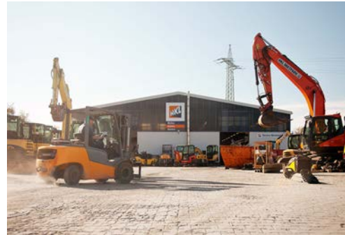
HKL baut sein Centernetz in NRW weiter aus: Im April öffnen die HKL Center in Duisburg und Bocholt.