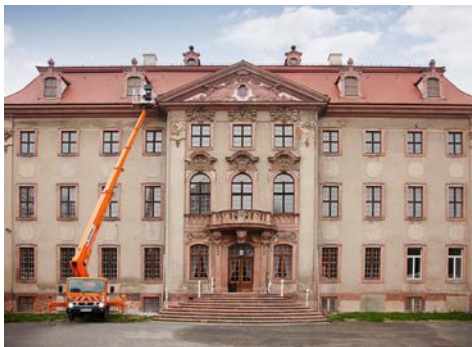
In märchenhafter Kulisse beweist der Ruthmann Steiger aus dem HKL Center Leipzig große Vielseitigkeit.