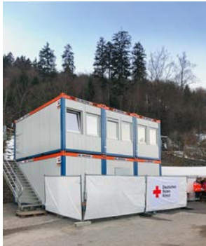
Beim Skisprung Weltcup in Willingen bieten HKL Raumsysteme Platz für Erste-Hilfe-Betreuung.