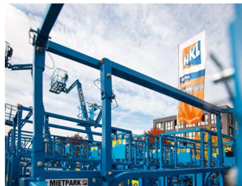
In Berlin, Stuttgart und Karlsruhe gibt es mit Jahresbeginn weitere HKL Center.