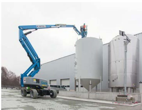
Die Genie Gelenk-Teleskopbühne aus dem HKL MIETPARK beim Einsatz in der neuen Holsten-Brauerei.