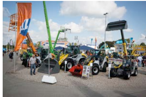
Auf der NordBau 2015 zeigt HKL einen Querschnitt seiner Baumaschinen, Baugeräte, Raumsysteme, Kommunaltechnik und Fahrzeuge.