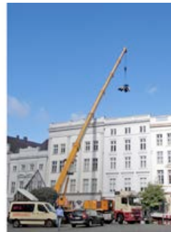
Spektakuläre Anlieferung: Für Arbeiten im Innenhof der Lübecker Altstadt Häuser werden Maschinen von HKL per Kran an ihren Einsatzort transportiert.