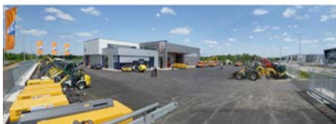
Das neue HKL Center Neuss überzeugt durch Modernität, gute Erreichbarkeit und Service auf höchstem Niveau.