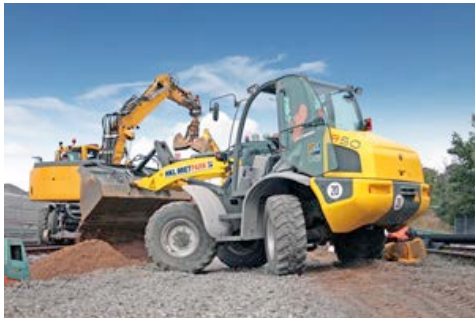
Ein allradgelenkter Radlader von HKL übernahm Transport und Umladung von Erdmassen und Schotter.