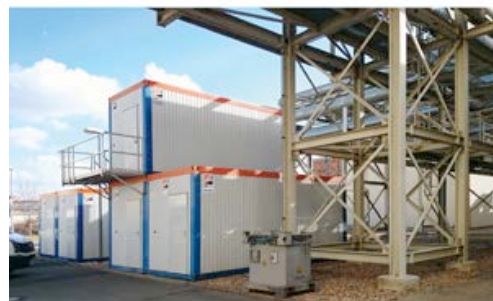
HKL Containeranlage am Standort Staßfurt.