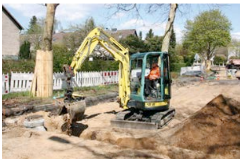
Alte Landstraße Hamburg: Minibagger aus dem HKL MIETPARK heben tiefe Gruben für Drosselwerke, Filterschächte und Rohrelemente aus.