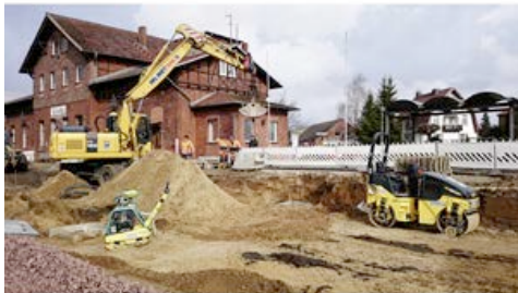
Mobilbagger, Kettenbagger, Walzen, Vibrationsplatten und Lichttaggregare aus dem HKL MIETPARK kommen beim Bahnhofsumbau in Crivitz zum Einsatz.