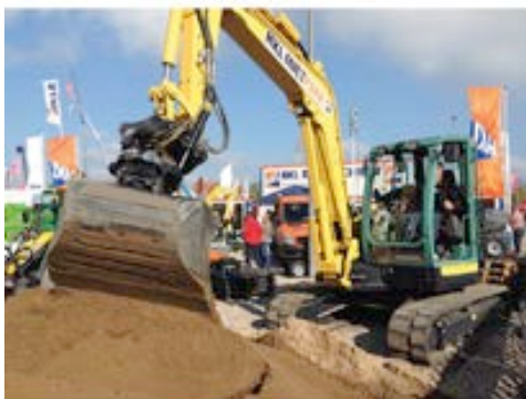
Der Branchenführer HKL präsentiert Qualitätsmarken wie Yanmar, Kramer, Kubota, Merlo und Ammann.