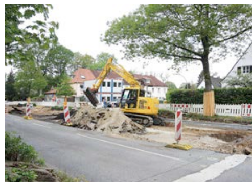
Maschinen und Container aus dem HKL MIETPARK begleiten die Grundinstandsetzung der Alten Landstraße in Hamburg. Die teilweise beengten Platzverhältnisse der Baustelle erforderten vorab eine genaue Planung der einzusetzenden Maschinen.