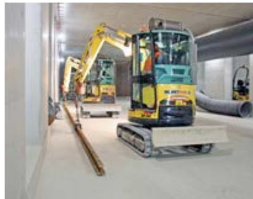
Wendige Kurzheckbagger von HKL beim Ausbau der U4: Für den Einsatz wurden die Maschinen extra mit einer Rußpartikel- und Abgasfilteranlage ausgestattet.