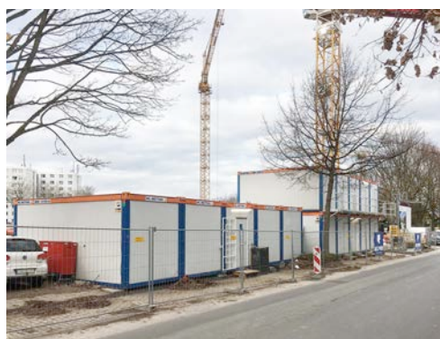
Während der gesamten Bauphase bietet eine zweistöckige Containeranlage von HKL mit insgesamt 17 Einheiten einen komfortablen Rückzugsort.