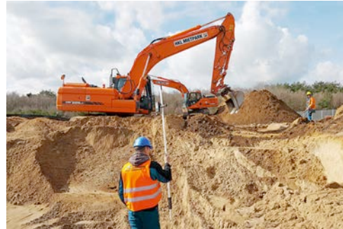
Einsatz in Schwerin: Speziell ausgestattete Doosan DX 225 Raupenbagger von HKL übernehmen Sondierung und Bergung von Kampfmitteln.