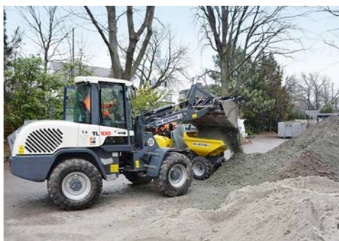
Bilden ein gutes Team im Palmengarten: Ein Terex Radlader und ein Neuson Dumper aus dem HKL MIETPARK.