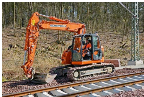
Der Raupenbagger Doosan DX140 aus dem HKL MIETPARK verrichtet alle anfallenden Erdarbeiten rund um die Gleise.