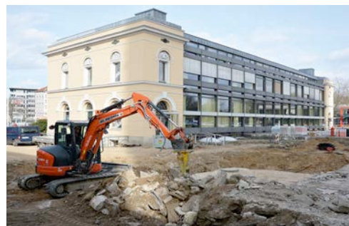
Der Kubota U48 Kompaktbagger aus dem HKL MIETPARK hilft bei Sanierungsarbeiten auf der Braunschweiger Okerinsel.