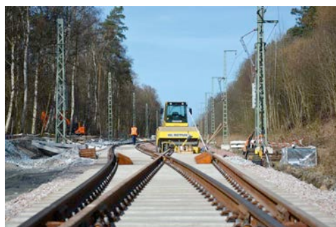
Feierabend: Nach getaner Arbeit verlässt der Bauleiter die Gleisbaustelle - Maschinen und Equipment sind für den nächsten Tag vorbereitet.