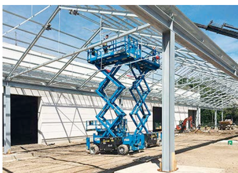
HKL punktete insbesondere mit Know-How und Spezialgeräten für die in luftiger Höhe anfallenden Stahl-, Aluminium- und Glasbauarbeiten.