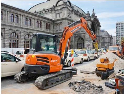
In Nürnberg wird der Bahnhofsvorplatz umgestaltet: Ein Minibagger aus dem HKL MIETPARK bereite die Verlegung von Versorgungsleitungen vor.