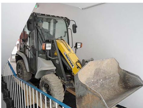
Ein Kramer Radlader 5035 aus dem HKL MIETPARK konnte aufgrund seiner kompakten Bauweise den Weg durchs Treppenhaus nehmen.