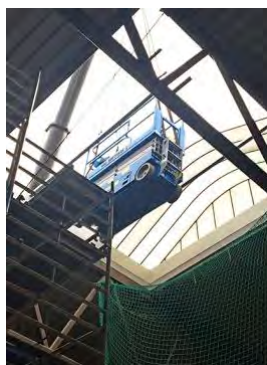
Ein Kran setzt die HKL Scherenbühnen an ihren Einsatzort im Dortmunder Berufskolleg.