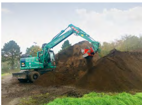
Die Allu Siebschaufel aus dem HKL MIETPARK im Einsatz am Hamburg Airport.