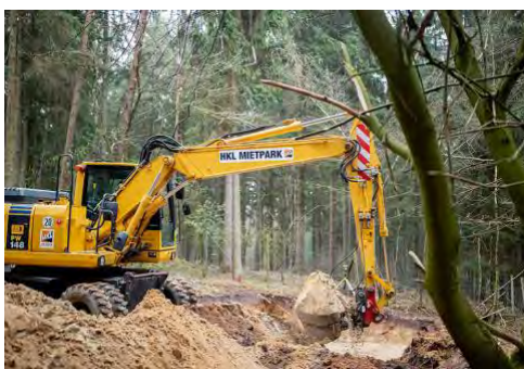
Baumaschinen aus dem HKL MIETPARK im Einsatz am Wildpark Lüneburger Heide.