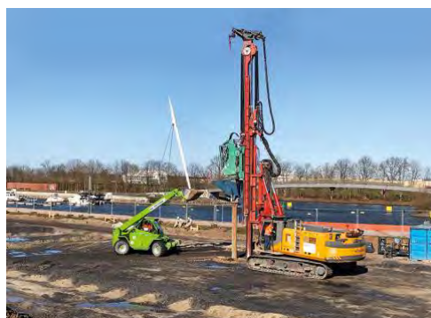
Ein Merlo Teleskoplader aus dem HKL MIETPARK unterstützt die Firma Geopier Spezialtiefbau GmbH in Gelsenkirchen.