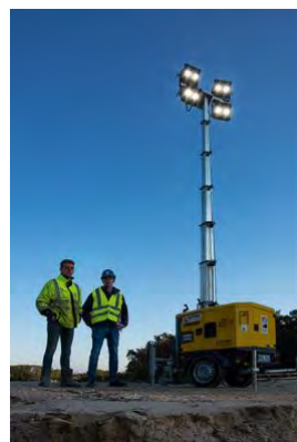
Insgesamt drei LED Lichtmaste HiLight H5+ aus dem HKL MIETPARK sorgen für ausreichend Helligkeit.