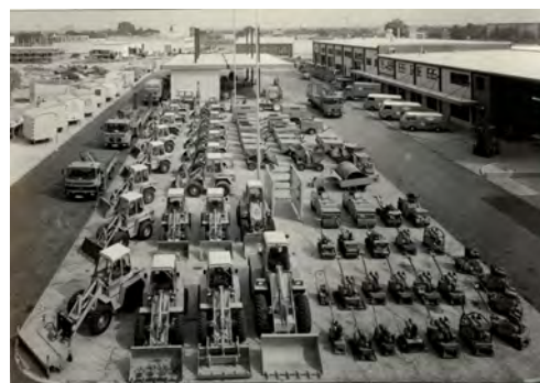
Schon 1980 verfügte HKL über einen großen Mietpark an kompakten Baumaschinen und Geräten.