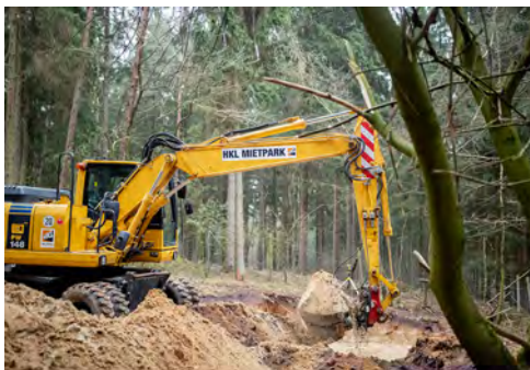
Baumaschinen aus dem HKL MIETPARK im Einsatz am Wildpark Lüneburger Heide.