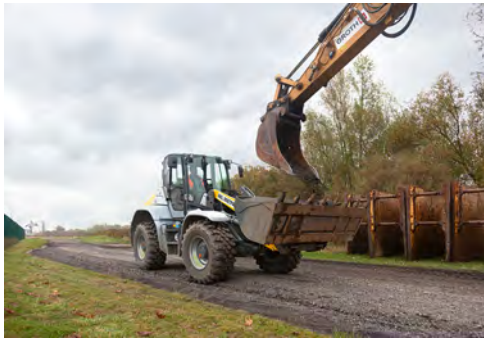
Mit dem Kramer 8155 führt HKL eine neue Größenklasse aus dem Kramer Radlader-Produktportfolio.