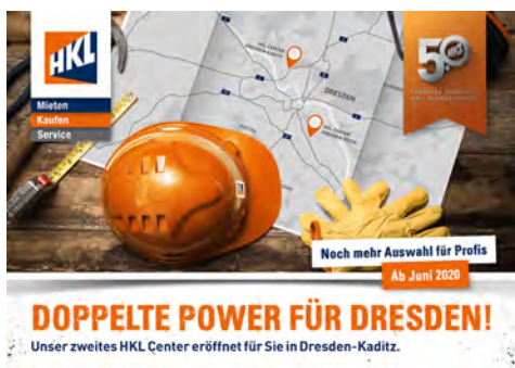
Anfang Juni eröffnete HKL sein zweites Center in Dresden – Kötzschenbroderstraße 140.